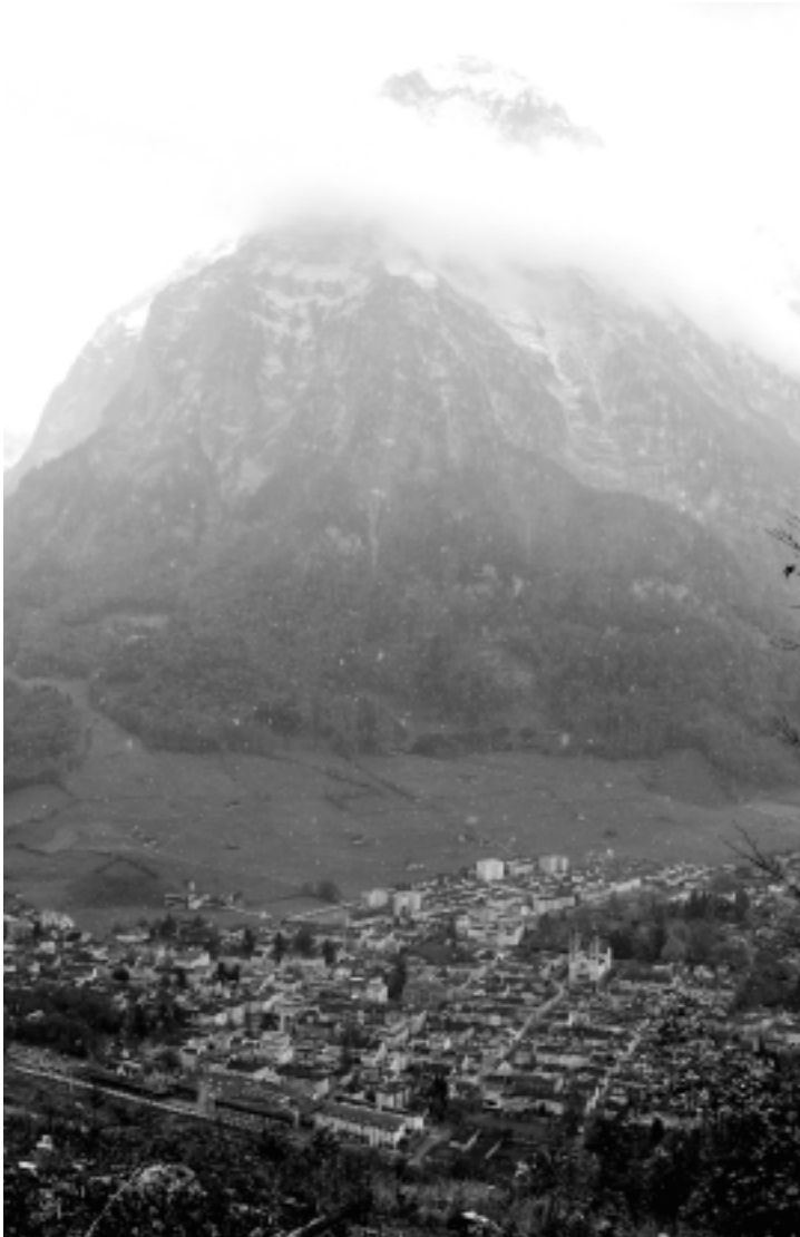
Glarus von oben, überragt vom Hausberg Glärnisch.