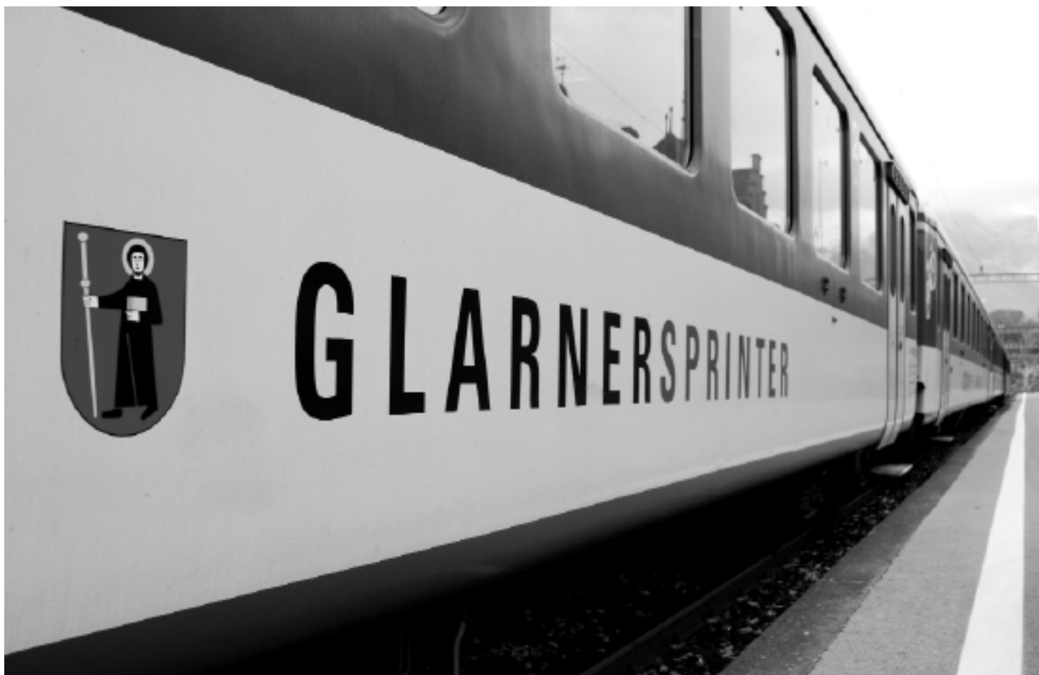
Der Glarner Sprinter verbindet den Zigerschlitz im Zweistundentakt mit dem Unterland.

marketing sind Familien mit Kindern, die die Natur bevorzugen und gerne in einem Eigenheim leben. Dank unserer tiefen Lebenshaltungskosten kommen wir den Familien oder auch allen anderen Zuzüglern sehr entgegen.»