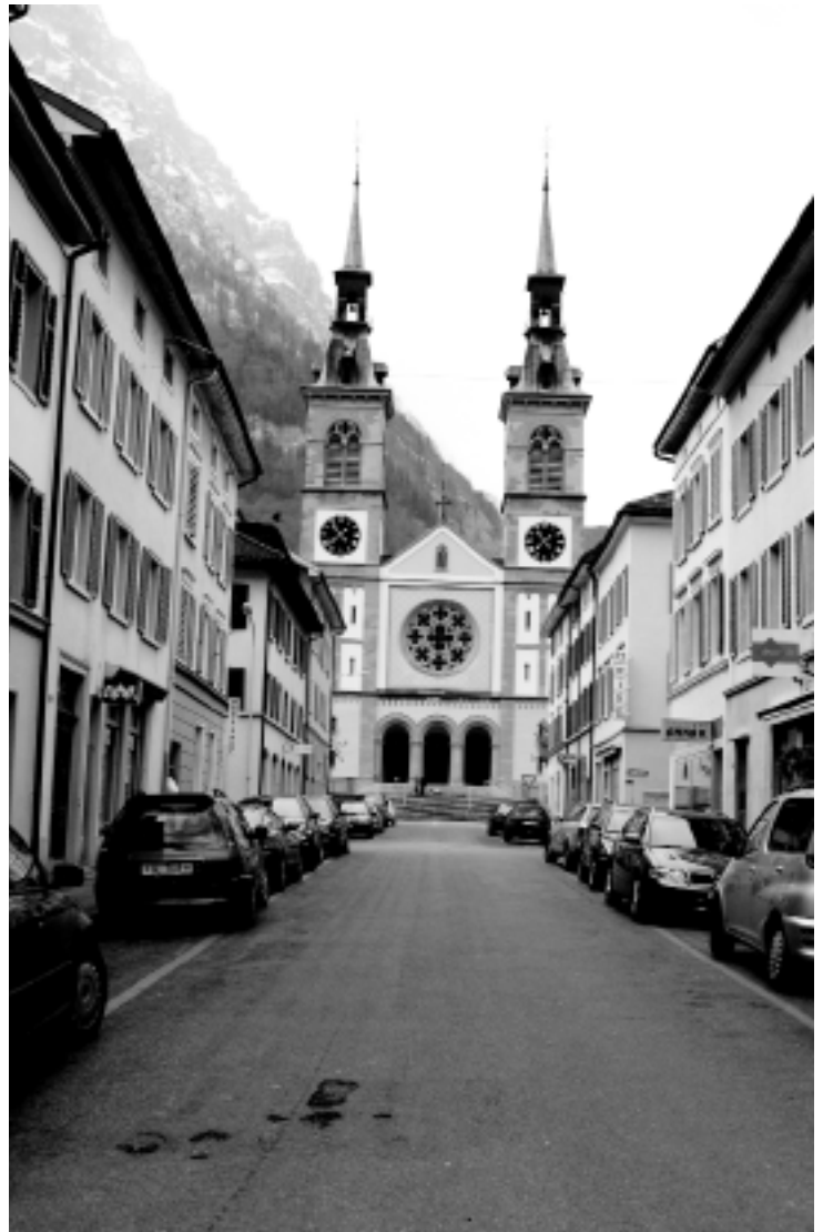
Die Stadtkirche Glarus thront über der Kirchgasse.