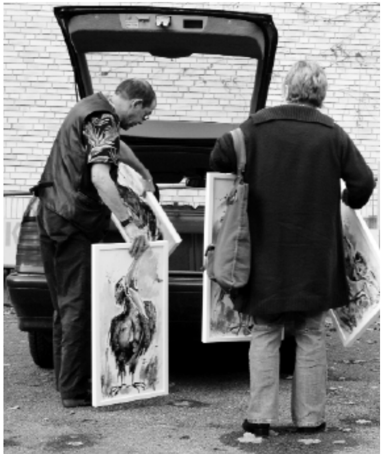
Vor dem Kunsthaus Glarus werden Bilder für die nächste Ausstellung ausgeladen.

ein Gründer- und Beratungszentrum, gemeinschaftlich durch die Kantone Glarus, St. Gallen und Schwyz betrieben. Laut Regierungsrätin Dürst hat sich das TZL in der Zwischenzeit sehr bewährt. Viele kleine Firmen mit Wachstumspotenzial konnten bereits angesiedelt und ortsansässige Firmen in Sachen Innovation beraten werden. In Schwyz, Jona und Sargans sind weitere Filialen entstanden. «Die Interessengemeinschaft Linthland will nun ebenfalls Gemeinden an der Kantonsgrenze mit ins Boot holen. Gemeint sind die Gemeinden aus der Region See, Gaster, March und Höfe», stellt Marianne Dürst in Aussicht.