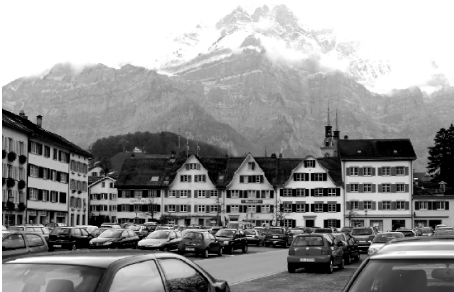
Der Zaunplatz in Glarus wird als Park- und einmal pro Jahr als Landsgemeindeplatz benutzt.